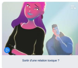
Sortir d'une relation toxique ?