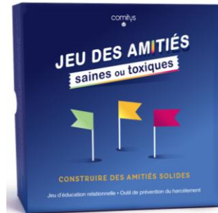
JEU DES AMITIÉS SAINES OU TOXIQUES