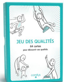
JEU DES QUALITES