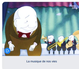
La musique de nos vies