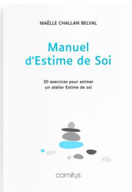
MANUEL D'ESTIME DE SOI