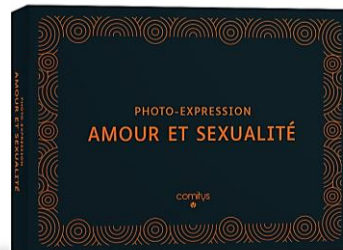
PHOTO-EXPRESSION AMOUR ET SEXUALITE