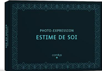
PHOTO-EXPRESSION ESTIME DE SOI