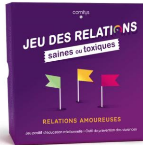
JEU DES RELATIONS SAINES OU TOXIQUES