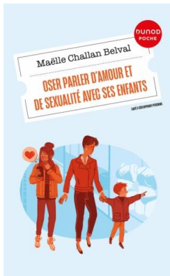
OSER PARLER D'AMOUR ET DESEXUALITE AVEC SES ENFANTS