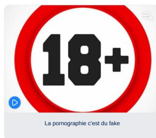
La pornographie c'est du fake