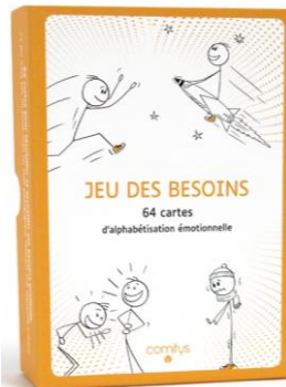
JEU DES BESOINS