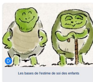
Les bases de l'estime de soi des enfants