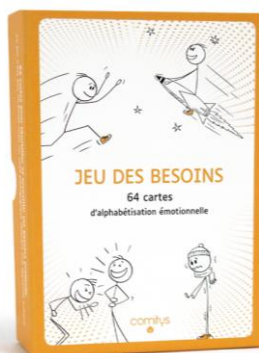
JEU DES BESOINS