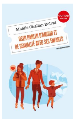
OSER PARLER D'AMOUR ET DESEXUALITE AVEC SES ENFANTS