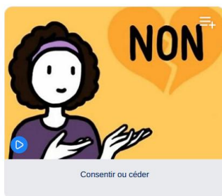
Consentir ou céder