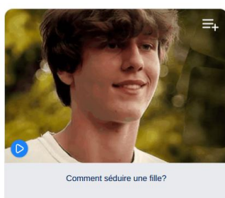
Comment séduire une fille?