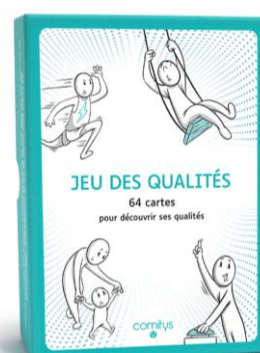
JEU DES QUALITES