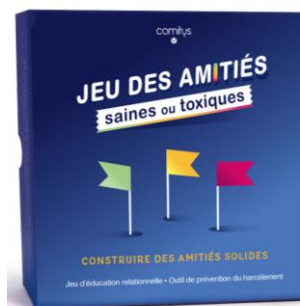
JEU DES AMITIÉS SAINES OU TOXIQUES