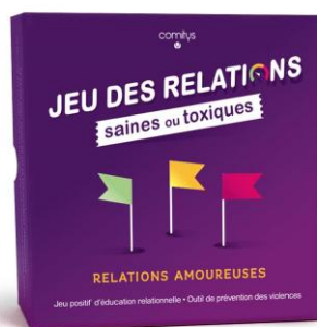
JEU DES RELATIONS SAINES OU TOXIQUES