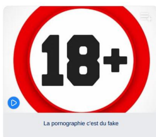
La pornographie c'est du fake