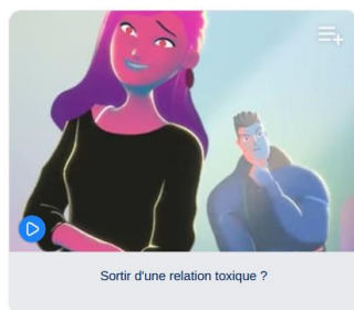
Sortir d'une relation toxique ?