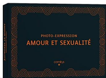
PHOTO-EXPRESSION AMOUR ET SEXUALITE