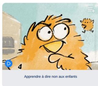
Apprendre à dire non aux enfants