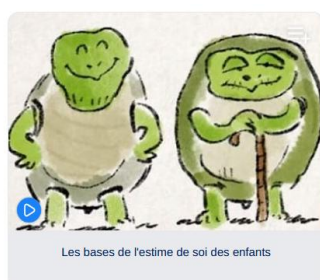
Les bases de l'estime de soi des enfants