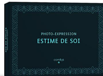
PHOTO-EXPRESSION ESTIME DE SOI