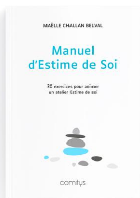
MANUEL D'ESTIME DE SOI