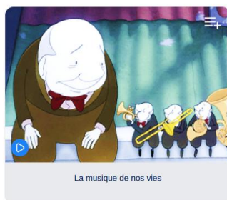
La musique de nos vies